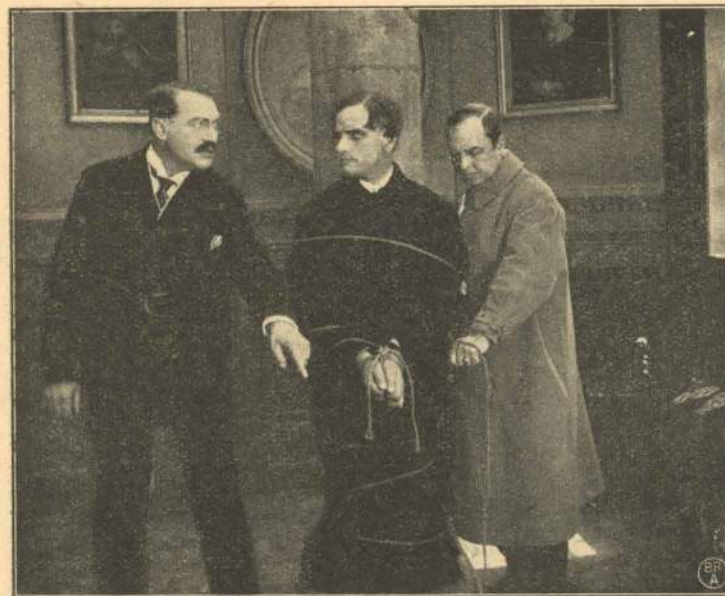
I Skurkenes Vold.

i Uvidenhed om den virkelige Aarsag til Grev v. Altburgs Selvmord, rykker ind som Herre paa Altburgernes gamle Slot. Men der kommer jo en Time, da han erfarer, at han har gjort en forkert Spekulation ved at gifte sig med Komtesse Ida. Pengeskabet er fyldt med Gældsbeviser, og Godset er belastet med Prioriteter til langt over dets Værdi. Fra den samme Time forandrer v. Jacob fuldstændig sin Opførsel overfor sin Hustru. Han hundser hende, som om hun var en Tiggertøs eller en Bedragerunge, der under falsk Foregivende har tilegnet sig Pladsen ved hans Side.