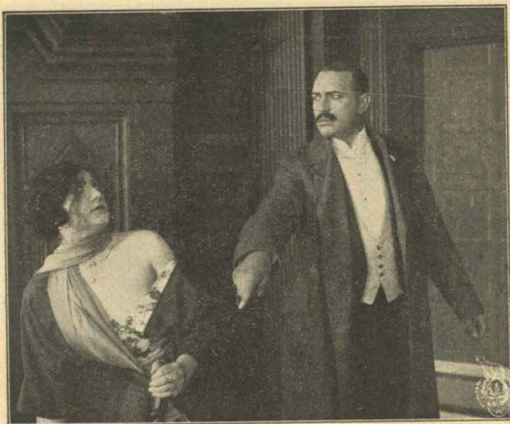
En brutal Ægtemand.

Samfundsslyngel, og at hun for længe siden har skænket sit Hjerte bort til en anden, nemlig Dr. Elsner. I Tankerne ser den gamle Grev v. Altburg den frygtelige Skandale nærme sig ham Fjed for Fjed. Han ved, at han alligevel ikke vil kunne overleve den, og han beslutter derfor selv at tage sig af Dage for saaledes at bøje Datterens Vilje. I et Brev, som han efterlader sig, udtaler han som sit sidste Ønske, at Ida vil give v. Jacob sit Ja. „Hun maa gøre det“, tilføjer han i sit Brev, „hvis hun ikke ønsker sin Faders Navn overgivet til Vanære“.