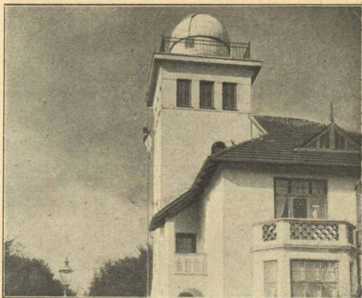
Ned fra Observatoriets Kuppel.

budt Dr. Elsner umaadelige Summer for hans Opdagelse — han har afvist alle Tilbud. For deres eget Velfærds Skyld maa de imidlertid have fat i hans Beregninger, og da de ikke kan faa dem med det gode, bestemmer de sig til at anvende Magt. Da Dr. Elsner, hidkaldt af Idas Brev, indfinder sig paa Godset, bliver han overrumplet og overmandet af Kornspekulanterne og deres Haandlangere. Efter at have tilvendt sig hans Beregninger, fatter de den grusomme Plan at dræbe ham, for at han ikke senere skal volde dem Ulejlighed, og v. Jacobs hævnerrige Hjerne har udspekuleret en frygtelig, raffineret Dødsmaade. Dr. Elsner føres ned i Slottets Fyrkælder, hvor han bliver