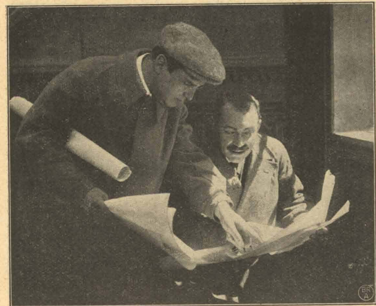
Korntrustens samvittighedsløse Ledere.

at hans egen Hustru søger at skade hans Planer, ikke undser sig for at lægge Haand paa hende, og da han frygter for, at hun ved Flugt skal unddrage sig den Hævn, han har tiltænkt hende, lader han hende indespærre i et af Slottets afsides beliggende Værelser.